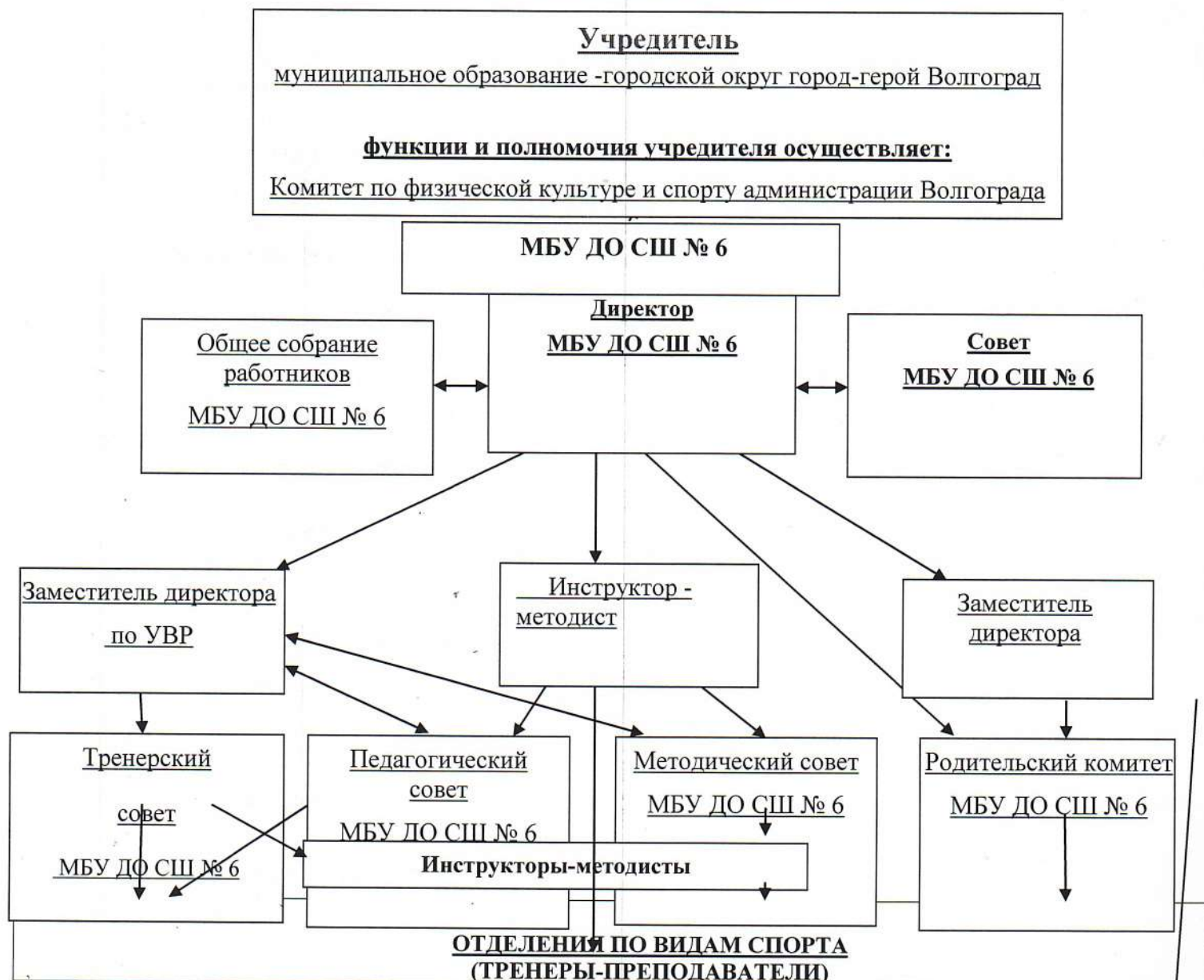
Схема структуры управления учреждения